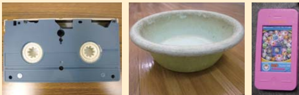
(左からビデオテープ、洗面器、おもちゃ)