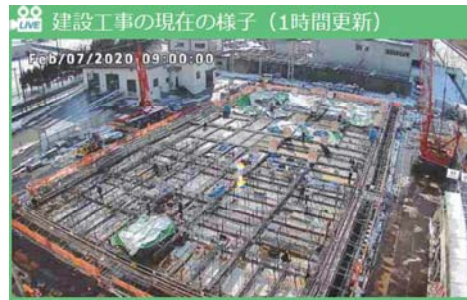
建設工場の現在の様子 (1時間更新)