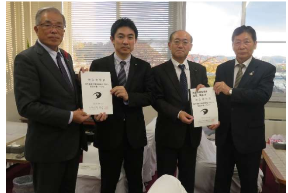
自由民主党福島県議会議員会へ要望書を提出しました。 福島県議会県民連合議員会へ要望書を提出しました。