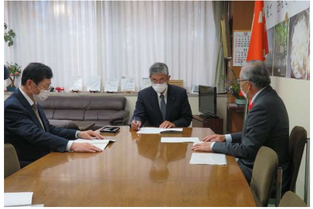
井出 孝利 副知事へ要望書を提出しました。